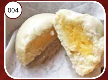
004 Nai Wong Pau Broodje gevuld met zoete pudding Bread with sweet custard