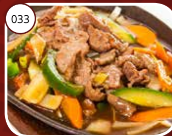
Kai Yuk* Kippenvlees* Chickenmeat*