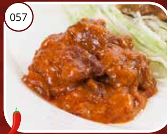
Hong Ma Yuk (LV) Peper rundsstoofvlees Pepper beef stew