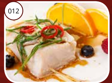
012 Qingzheng Yu (GV, LV) Gepocheerde vis op Kantoneze wijze Cantonese style poached fish