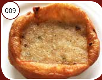
009 Tja Mai Kuun (GV, LV) Gebakken kleefrijst Fried glutinous rice