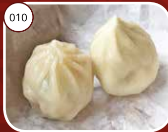
010 Shiao Long Pau Shanghaise vleespasteitjes Shanghai style meat dumplings