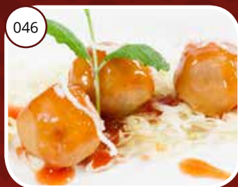
046 Koe Lou Yuk (LV) Krokante vleesballetjes Crispy meatballs