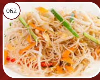
Chow Mifang (GV,V,LV) Mihoen Rice noodles