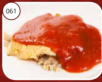
Foe Yon Hai (LV,V) Omelet in tomatensaus Eggs with tomato sauce