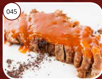
045 Fo Yuk (LV) Babi Pangang Crispy meat