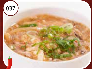
Wanton Tāng (LV) Flensjes gevuld met vlees Meat dumplings soup