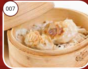
007 Woe Tip (LV) Half rond vormig vleespasteitjes Half round shaped pork dumplings