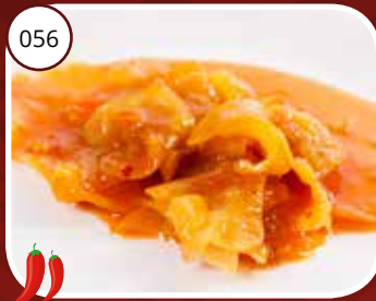
Ma Tjoy (LV,V) Kool met sambalsaus Cabbage with sambal sauce