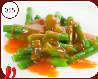
Ma Thó (LV,V) Boontjes met sambalsaus Beans with sambal sauce