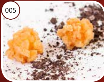
005 Ha Toast (LV) Krokante garnalen bol Crispy shrimp ball