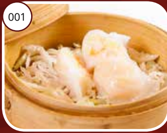
001 Ha Kau (GV, LV) Garnalenpasteitjes Shrimp dumplings