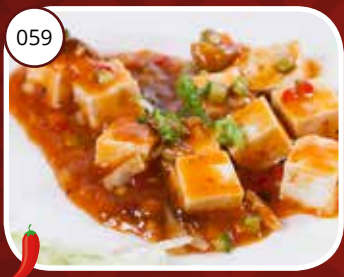
Mapo Taufu (LV,V) Tofu met maposaus Tofu with mapo sauce