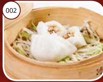
002 Fan Koh (GV, LV) Vleespasteitjes Pork dumplings