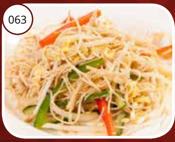
Chow Mien (V,LV) Chinese bami Chinese noodles