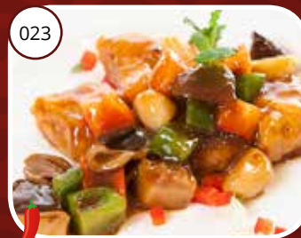
Shiu Kôh Yù (GV, LV) Tongfilet in vruchtensaus Fish filet with fruit sauce