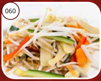
Tjap Tjoy (GV,LV,V) Gewokte groentennmix Vegetables mix