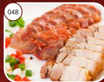
048 Shung Phing (GV, LV) Vlees mix Meat mix