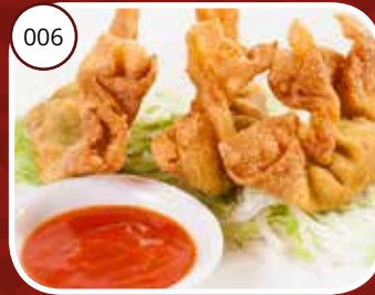
006 Tja Shiu Kau (LV) Krokante flensjes met garnalen Crispy shrimp dumplings