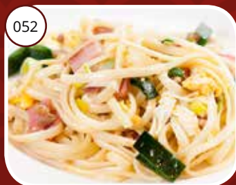
052 Bami Goreng (LV) Gebakken bami Fried noodles