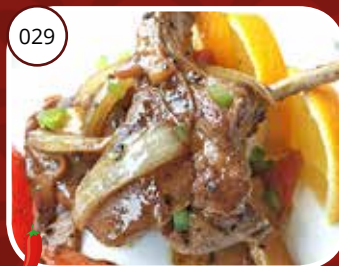
Chilli Shung Phing (GV, LV) Mix vlees met chilisaus Mixed meat with chili sauce