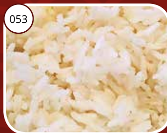
053 Pah Fan (GV, LV, V) Witte rijst Steamed rice