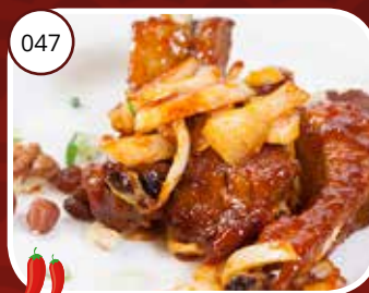
047 Chili Kwat (GV, LV) Ribben met chilisaus Ribbs with chili sauce