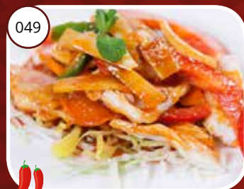
049 Chili Kai (GV, LV) Kipfilet in chilisaus Chicken in chili sauce