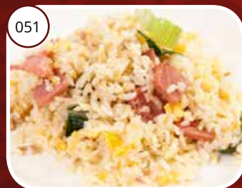
051 Nasi Goreng (GV, LV) Gebakken rijst Fried rice