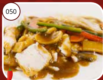
050 Lee Kai (LV) Kipfilet in kerrysaus Chicken in curry sauce