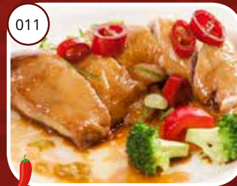
011 Shuan La Kai (GV, LV) Zuur-pittige kip Sour spicy chicken