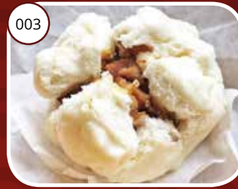
003 Cha Siew Pau Broodje gevuld met zoet vlees Bread with sweet pork