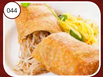
Chilli Kai Dé (GV, LV) Kipsaté met pittige chilisaus Chicken satay with sharp chili sauce